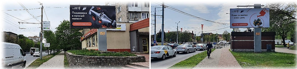
Иллюстрация 18 Наружная реклама Центра «Мой Бизнес» на улицах Калининграда

Подготовлены и размещены 20 рекламных баннеров на наружных носителях в Калининграде и области. Более ста информационных материалов для печатных изданий – журналы «Бродвей», «Королевские ворота» и иные.