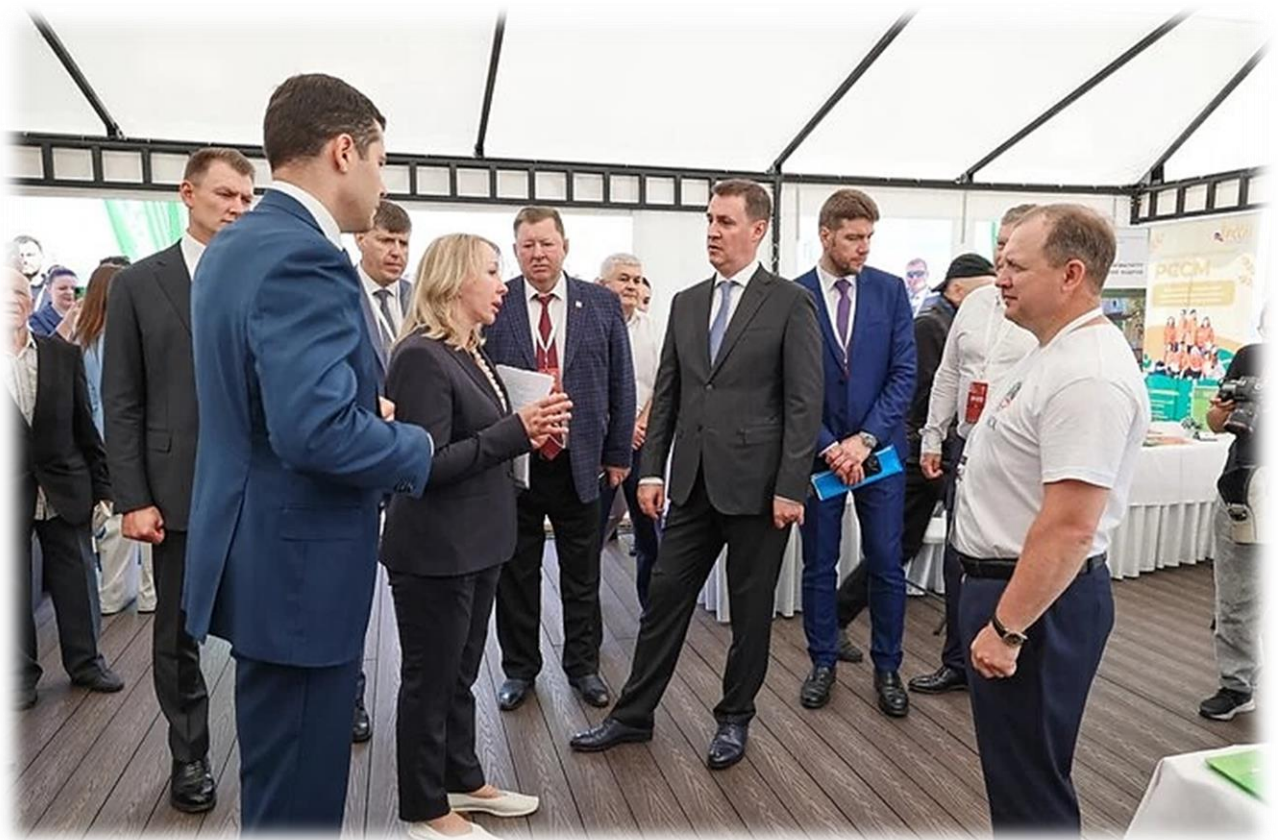
Иллюстрация 16 Выставка «Всероссийский день поля 2022»

В рамках Всероссийской агропромышленной выставки «Золотая осень 2022» отдел «Центр компетенций в сфере сельскохозяйственной кооперации и поддержки фермеров» награжден Благодарностью Министра сельского хозяйства Д.Н. Патрушева «За оказание содействия развитию субъектов малого и среднего предпринимательства в АПК», получил две золотые и две серебряные медали: