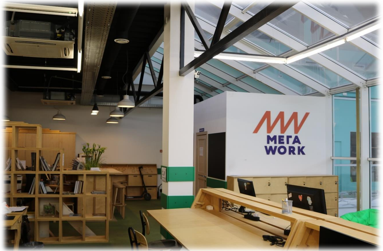
Иллюстрация 7 Коворкинг в Фонде «Центр поддержки предпринимательства Калининградской области»

Большая часть мероприятий, реализуемых отделом, проводится на площадке Лекториума, а в свободные время арендуется сторонними предпринимателями и физическими лицами для проведения мероприятий.