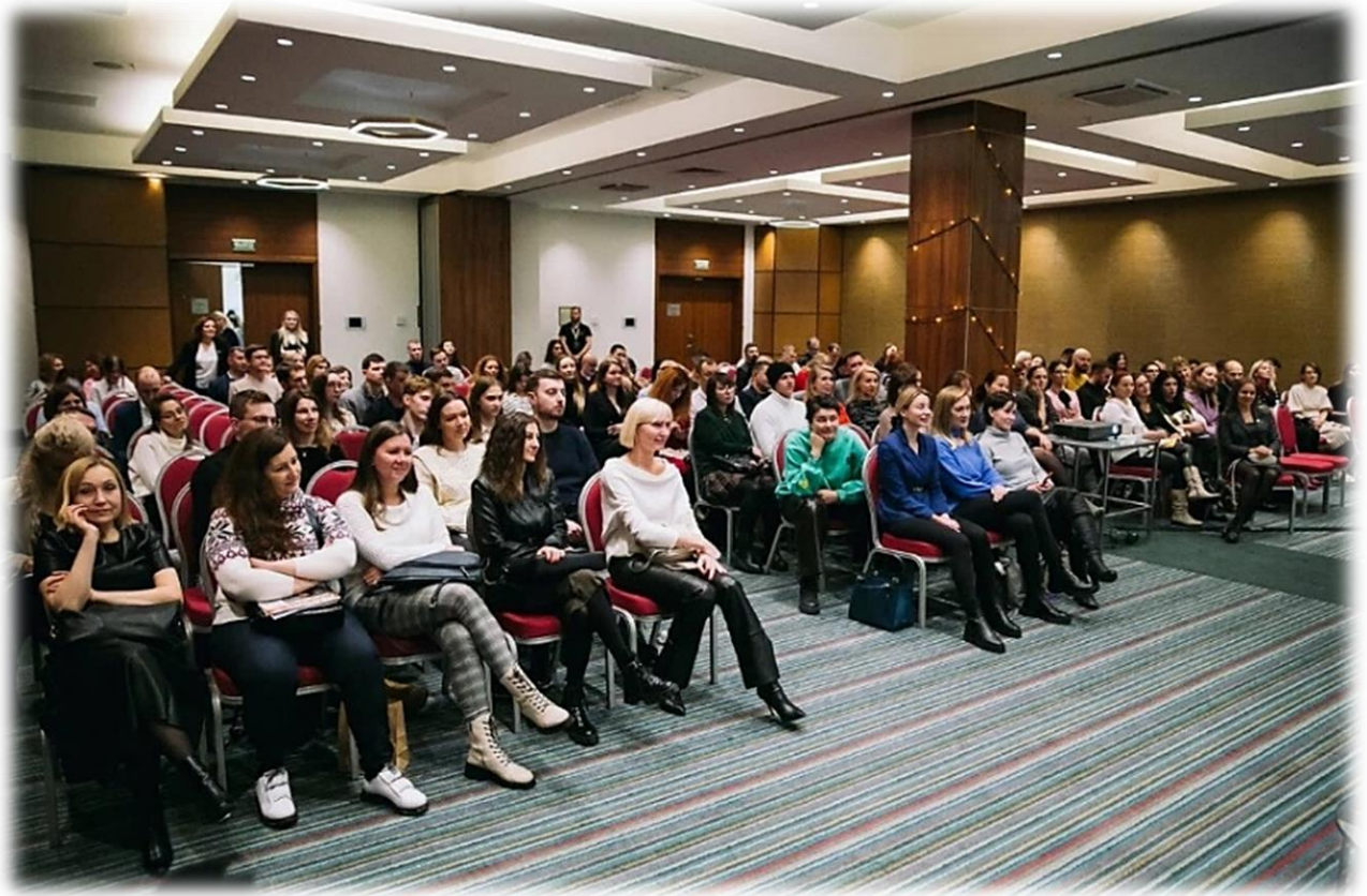
Иллюстрация 4 Ежегодный Балтийский бизнес-форум «Мотивация. Лидерство. Успех»

В области выставочно-ярмарочных мероприятий: