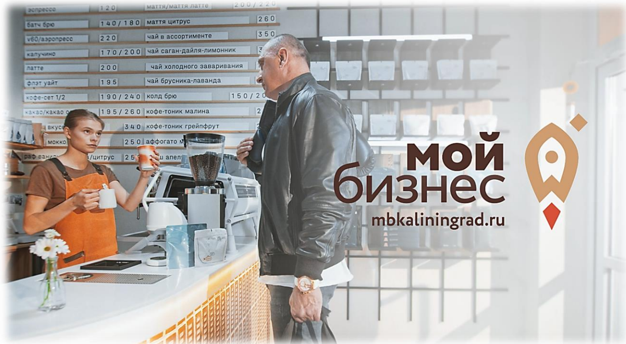
Иллюстрация 19 Промо-ролики Центра «Мой Бизнес Калининград»

Созданы актуальные узнаваемые презентационные ролики Центра «Мой Бизнес», которые размещены и транслируются на мониторах в сети МФЦ «Мои Документы», а также в региональных рекламных блоках на канале СТС и иных.