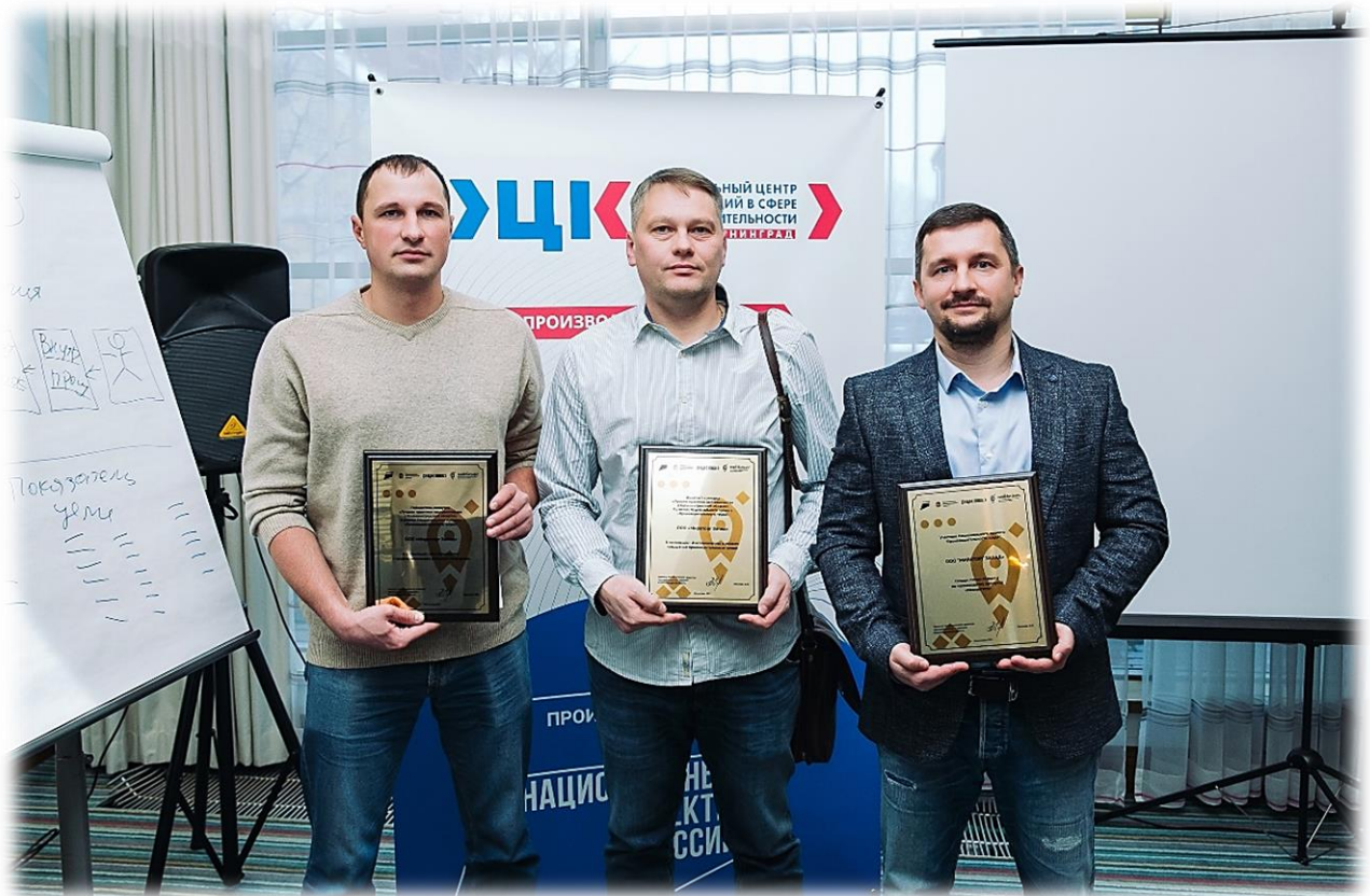
Иллюстрация 14 Победители конкурса «Лучшие практики наставничества» ООО «Мираторг-Запад»

С марта 2022 года Калининградская область совместно с Госкорпорацией Росатом реализует проект «Эффективный регион». За время первой «пилотной» волны проекта его участники – несколько министерств региона, МФЦ, Центр занятости, учреждения здравоохранения и администрация Калининграда – достигли запланированных показателей. К проекту активно подключился