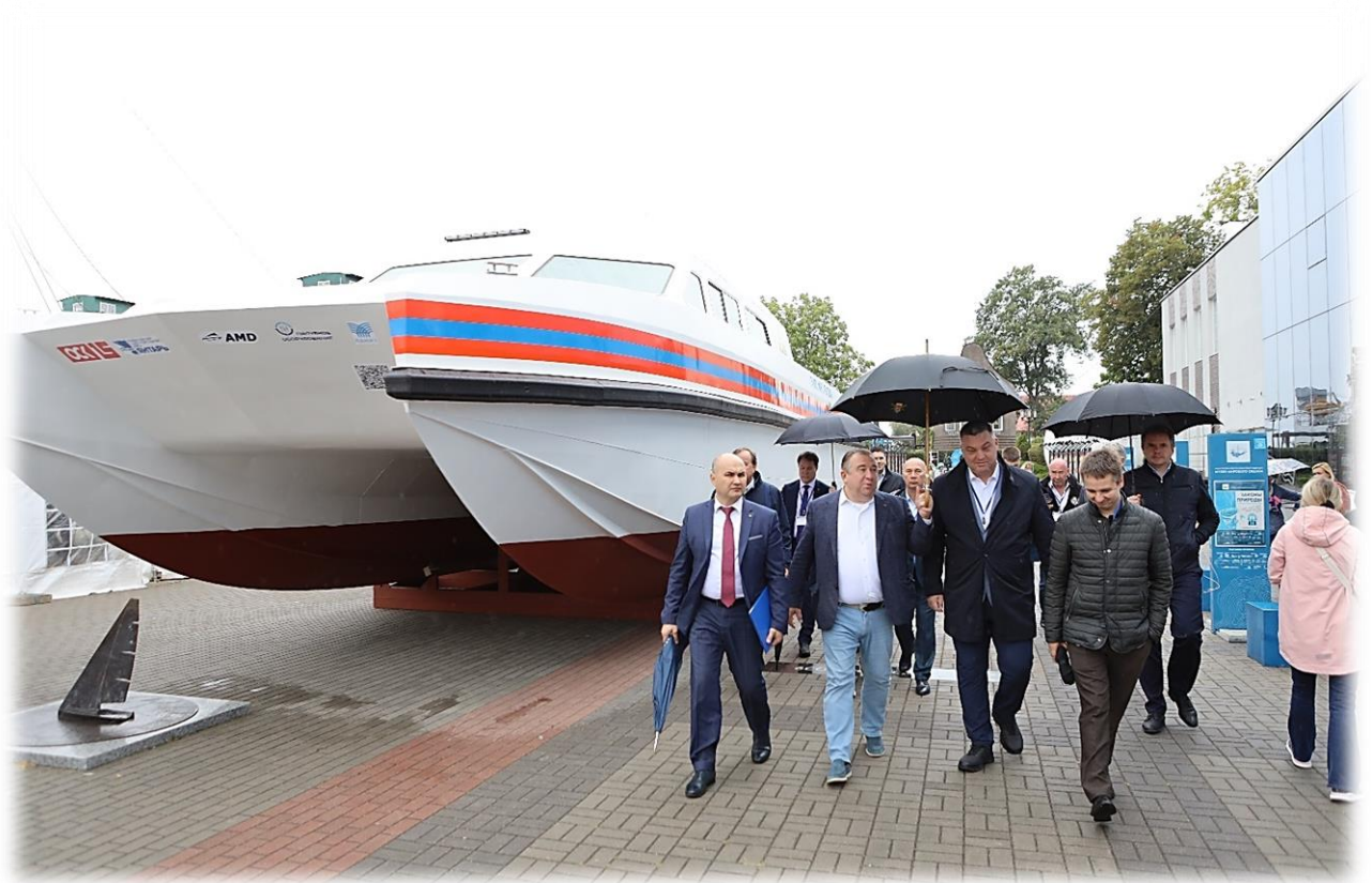
Иллюстрация 11 Конференция «Маломерное и малотоннажное судостроение России» (SLS Russia)

Совместно с Ассоциацией «Кластер янтарной промышленности Калининградской области» была проведена региональная выставка-ярмарка «День Янтаря», в которой приняли участие 16 компаний кластера. Мероприятие посетило более 2 000 человек.