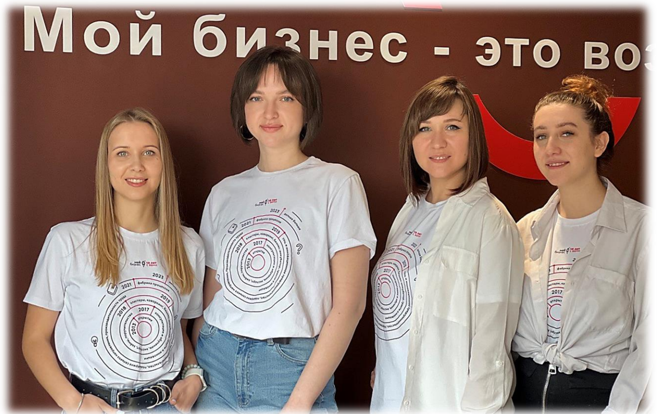
Иллюстрация 8 Сотрудники отдела «Консультационный центр»

Отдел «Консультационный центр» совместно с органами социальной защиты населения муниципальных образований Калининградской области оказал методическую поддержку в подготовке документов, а также подготовил заключения по бизнес-планам заявителей на ведение предпринимательской деятельности.