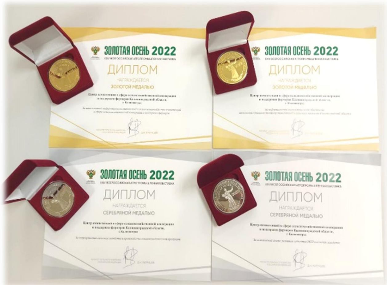
Иллюстрация 17 Награды отдела за работу в 2022 году

Центром проведена работа по разработке концепции, сбору материалов, созданию и выпуску фильма и книги, посвященного 75-летию агропромышленного комплекса Калининградской области.