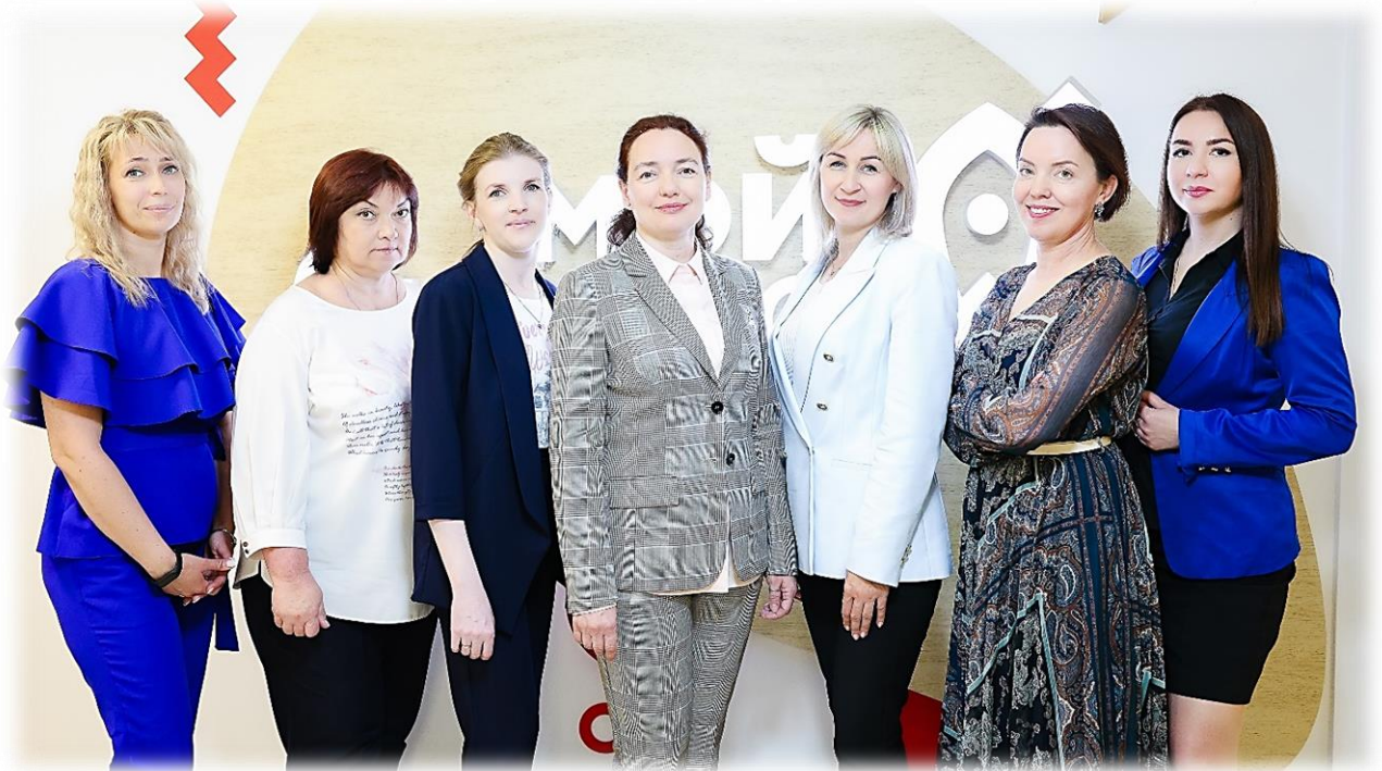
Иллюстрация 20 Сотрудники бухгалтерского отдела Фонда

В начале 2023 года Фондом пройден полный аудит бухгалтерской (финансовой) отчетности за 2022 год. По итогам получено положительное заключение. Успешно пройдена плановая выездная проверка, назначенная Управлением Федерального Казначейства за период 2019-2022 годы.