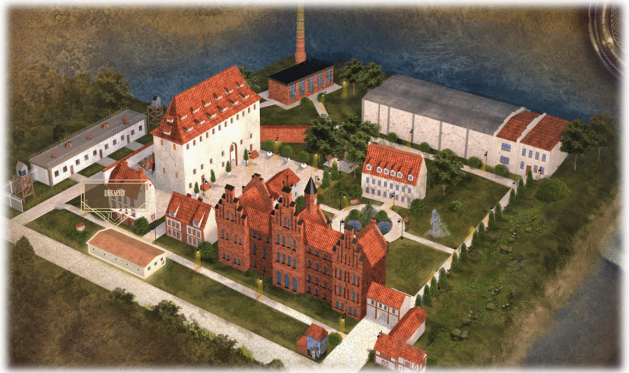
Иллюстрация 1 Проект ревитализации замка Тапиу в городе Гвардейске

Больше половины заявок – это удаленные муниципалитеты: Советск, Гвардейск, Черняховск, Правдинский район. В рамках этих проектов планируется создать более 300 новых рабочих мест.