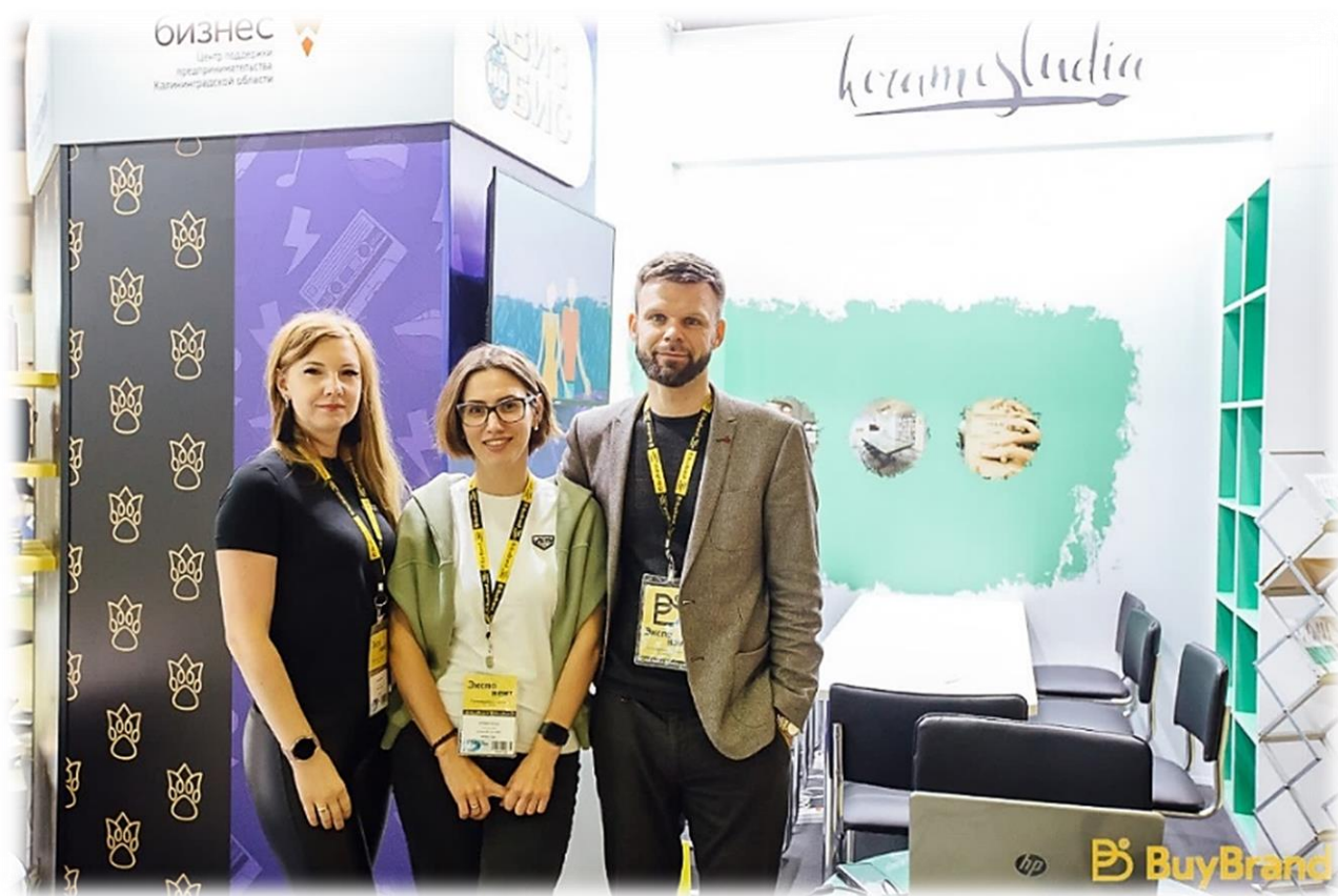
Иллюстрация 5 Международная выставка франшиз BuyBrand Экспо 2022

Разработан и полноценно запущен региональный маркетплейс для самозанятых «Артисон» ( https://artisone.ru/ ). ARTIS ONE – это интернет площадка, которая объединяет региональных самозанятых – ремесленников, артистов, ведущих, консультантов, репетиторов, гидов, дизайнеров, фотографов и другие уникальных личностей, с возможностью заказа товаров и услуг.