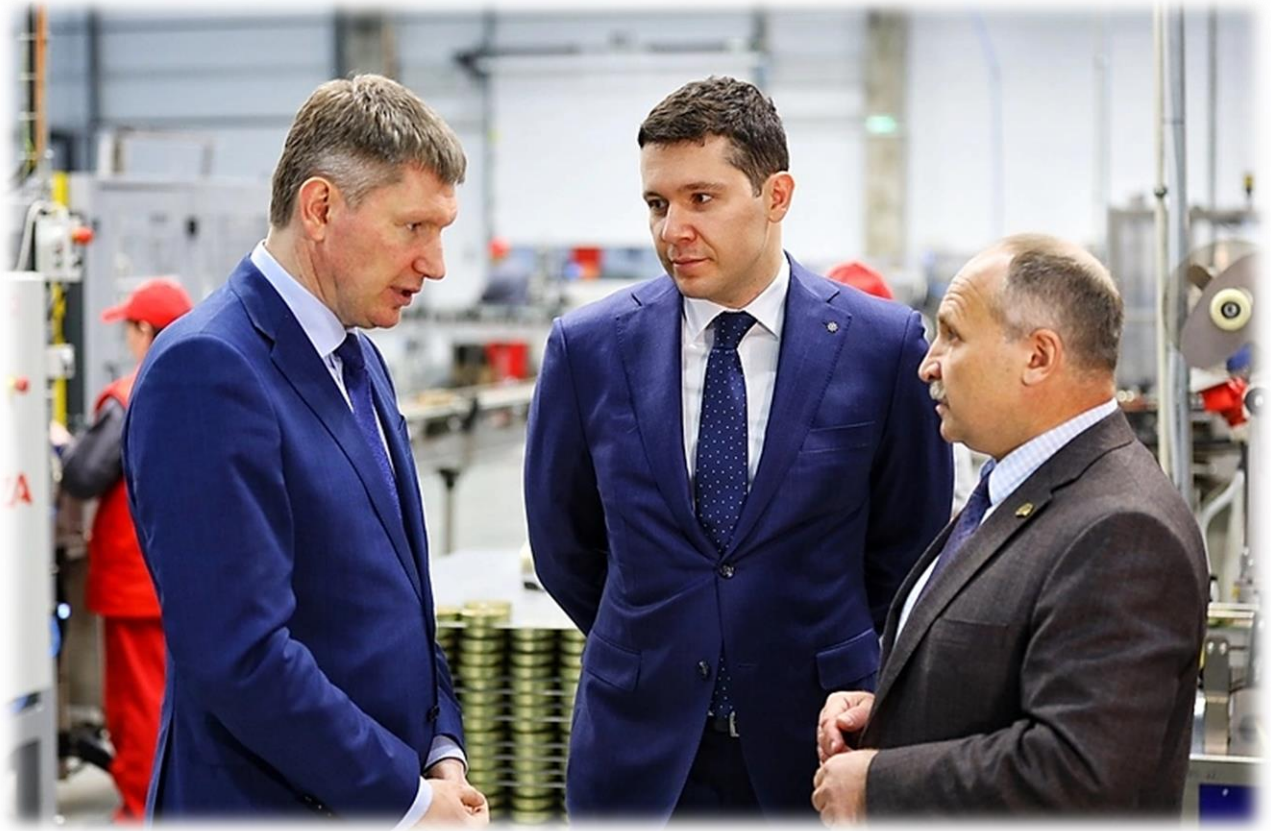
Иллюстрация 13 Презентация нового цеха рыбоконсервного завода ГК «За Родину»