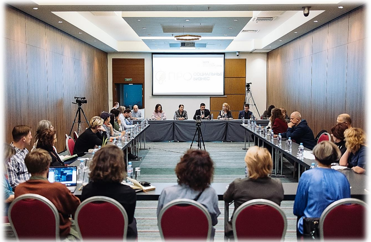
Иллюстрация 10 Круглый стол по актуальным темам в сфере социального предпринимательства

В 2022 году отдел «Центр инноваций социальной сферы» стал организатором и оператором регионального этапа Всероссийского конкурса «Лучший социальный проект года». В рамках регионального этапа было подано для участия 32 заявки от субъектов МСП и НКО. По итогам заседания экспертной комиссии 7 проектов были признаны победителями. Все победители в основных номинациях были рекомендованы отделом «Центра инноваций социальной сферы» для участия в федеральном этапе конкурса, который пройдет в 2023 году.