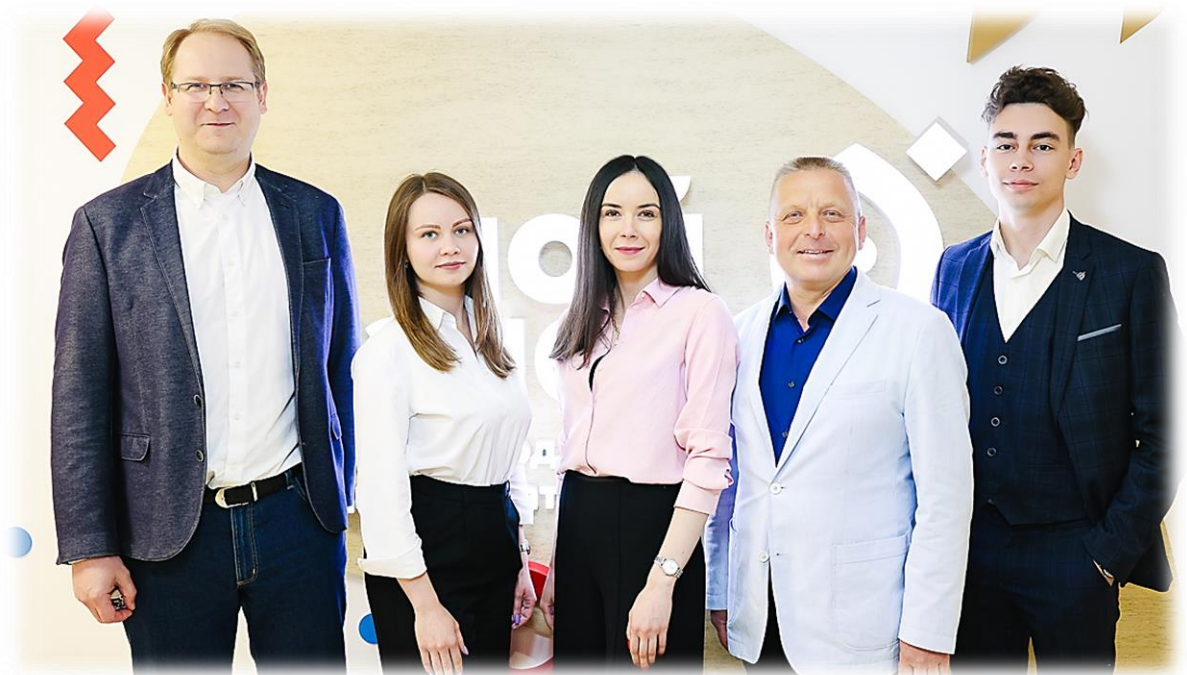
Иллюстрация 12 Сотрудники отдела Инновационный инжиниринговый центр

Одним из ярких примеров успешного развития резидентов является ООО «Школа беспилотной авиации». Проект «Образовательная онлайн платформа UAVProf». За период 2022 года в несколько раз увеличились финансовые показатели, а штат сотрудников вырос с 7 до 25 человек.