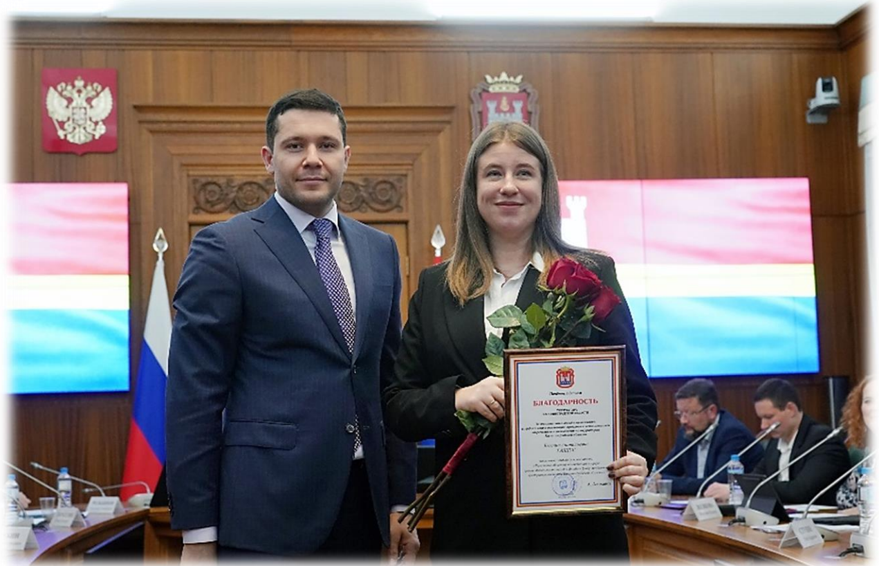
Иллюстрация 15 Вручение благодарности за вклад в организацию проектов с использованием бережливых технологий