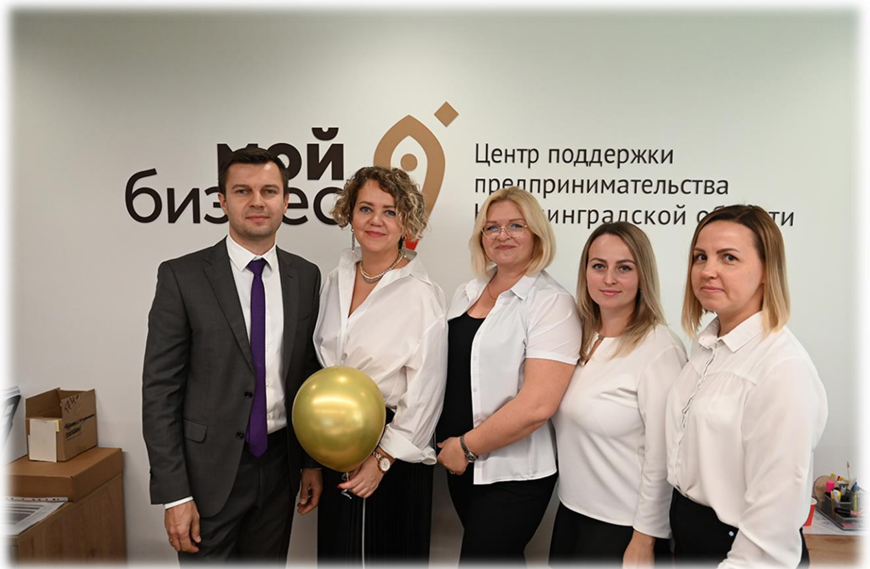
Иллюстрация 2 Открытие нового пространства для предпринимателей

Кроме того, участвуя в беспроигрышной лотерее, предприниматели получали возможность выиграть сертификат на льготный микрозаём по ставке в три, два или даже один процент годовых.