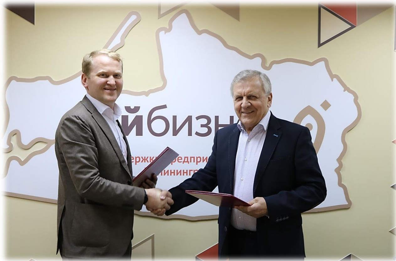
Иллюстрация 3 Подписание соглашения о сотрудничестве с АНП «СО «Строительный союз Калининградской области»

Такого рода партнёрство стало первым среди региональных гарантийных организаций и позволило компании ООО «МОНОЛИТ», которая входит с союз строительных компаний, получить заем с привлечением поручительства Гарантийного фонда в размере 17,4 млн руб.