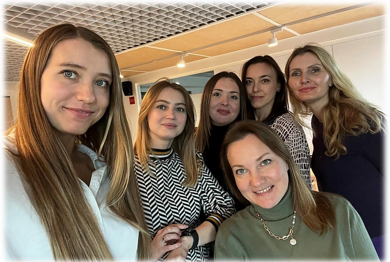
Иллюстрация 21 Сотрудники юридического отдела Фонда

Проведена правовая экспертиза заявителей, предоставленного обеспечения и поручителей по проектам финансирования, реализуемых Фондом, и подготовлены заключения по более 600 (шестистам) комплектам документов.